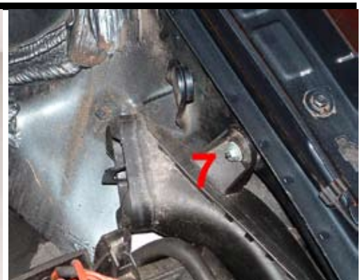
6. Demontera skruven (7) från innerskärmen.