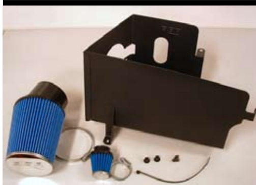
1. Innehållsöversikt opti-flow.