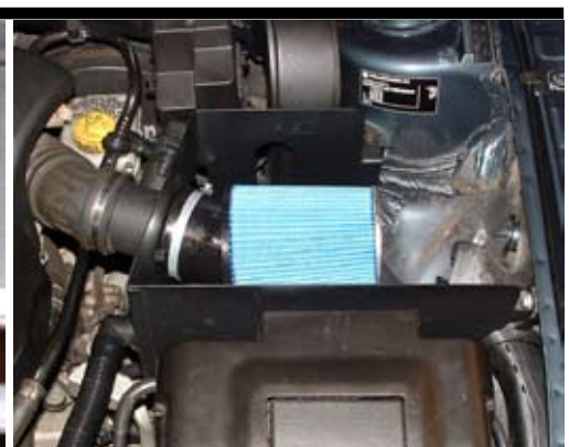
9. Montera insugsslang och kontaktstycke till LMM. Montera batterikåpa och BSR luftfilter.