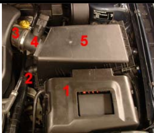
2. Demontera batterikåpan (1). Lossa sekundär-luftröret (2) från luftfiltermodulen (5). Lossa insugsslangen (3) från LMM (Luftmängdmätaren).