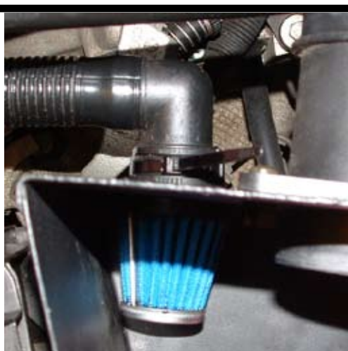
8. Montera BSR sekundär-luftfilter. För in filtret i det utskärda hålet i avskärmningsplåten. Tryck in det i plastslangen. Sätt fast med medföljande kabelband.