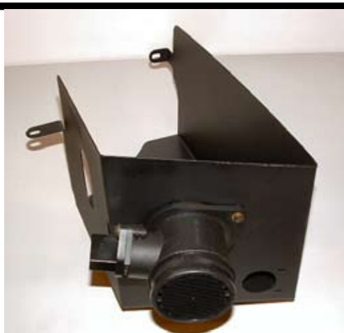
5. Montera klipsen ( medföljer) till LMM. Flytta över LMM från luftfiltermodulen till avskärmningsplåten. Fäst med medföljande skruvar.