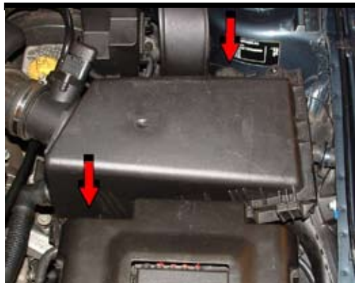
4. Demontera luftfiltermodulen. Lossa skruvarna som håller luftfiltermodulen enligt bild. Lyft den sedan uppåt och dra ut den från upphängningsfästet i innerskärmen.