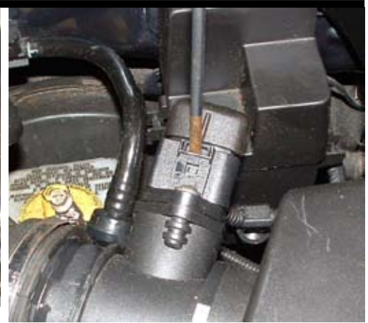
3. Demontera kontaktstycket till LMM. Använd skruvmejsel enligt bild.